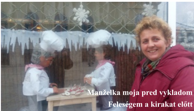
Manželka moja pred vykladom Feleségem a kirakat előtt

Sme sa o tom dozvedeli zo strán Trubnika, že na Slovensku existuje kúpalisko, čo má skoro takístu