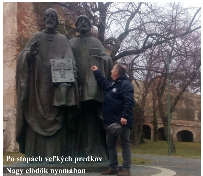
Po stopách veľkých predkov Nagy elődök nyomában

A Trubnik lapjairól értesültünk, hogy Szlovákiában olyan fürdő található, melynek a vize közel olyan összetételű, mint a Holt tenger. A bellegszencsei fürdő Nyitra és Léva között helyezkedik el. Ketten, feleségem és én kihasználtuk a lehetőséget és négy napot töltöttünk Bellegszencsén. Egyebek mellett Nyitrát, a szlovák nemzet bölcsőjét is meglátogattuk. Ottani utunk a szépséges várba vezetett, mely a központban terül el. A vár kapuja előtt magasodik Szent Cirill és Szent Metód szobra. Szent Cirill magasra felemelt keze áldást oszt, bal kezében pedig könyvet tart, korabeli kötésben. A borítólapján Jézus Krisztus testének korabeli, domborműves ábrázolása. Szent Metód bal kezében római ékszeres dobozt tart.